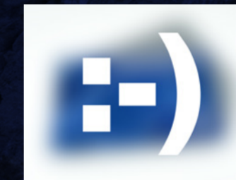
[Glæd dig! Kommer snart]