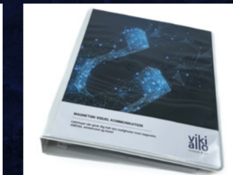
Magnet & Stål